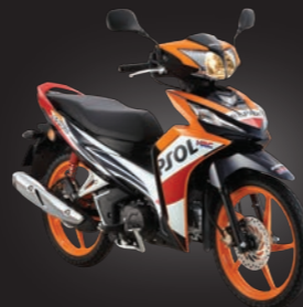
Luminous Repsol Orange Repsol Jingga Berkilau

*Actual model may vary in detail from image shown and specifications are subject to change without prior notice. * Model sebenar mungkin berbeza dari imej tertera dan spesifikasi boleh ditukar bila-bila masa tanpa notis.