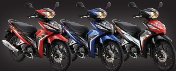
Vivacity Red Merah Lincah Vital Blue Metallic Biru Vital Metalik Pearl Magellanic Black Hitam Mutiara Magellen